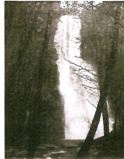
Concello da Fonsagrada Concellería de Medio Ambiente